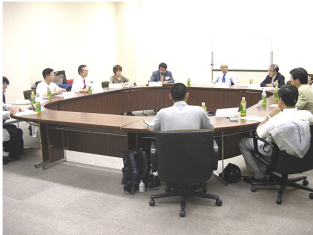
インターアクト・米山財団奨学生・青少年交

換留学生・ローターアクトの4つの代表が、テクスピア大阪に集まり、会合を8月31日に開催いたしました。