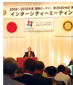
ガバナー 村上 有司