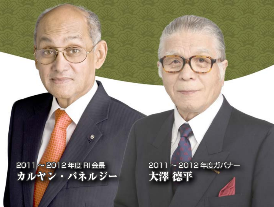
2011～2012年度RI会長 カルヤン・パネルジー