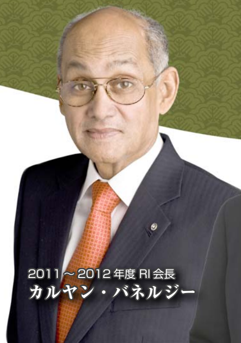
2011～2012年度RI会長 カルヤン・パネルジー