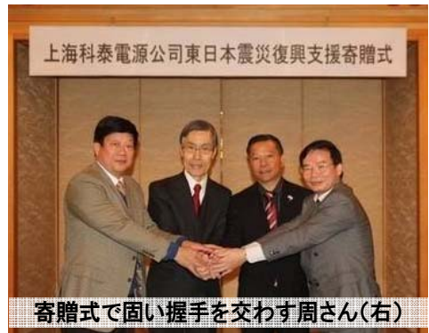
寄贈式で固い握手を交わす周さん(右)

周さんは、立命館大学政策科学部で被災地復興のための政策研究チームを組織、また、昨年設立された日本ロータリー E クラブ 2650 の創立会員として、ロータリー活動にも積極的に参加しています。「被災地はまだ大変な状況で、息の長い支援が必要。政策科学の研究者として、また、ロータリアンとして、これからも被災地の復興のために尽力していきたい」と語っています。